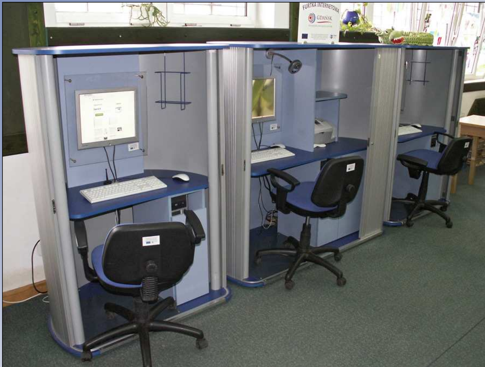
moduł furtki internetowej